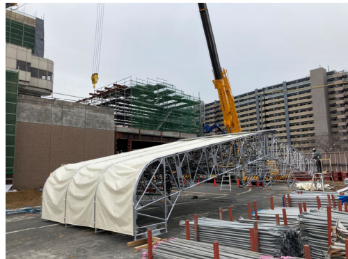
管理諸室テント組立状況