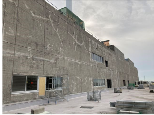
工場棟西面石綿除去完了