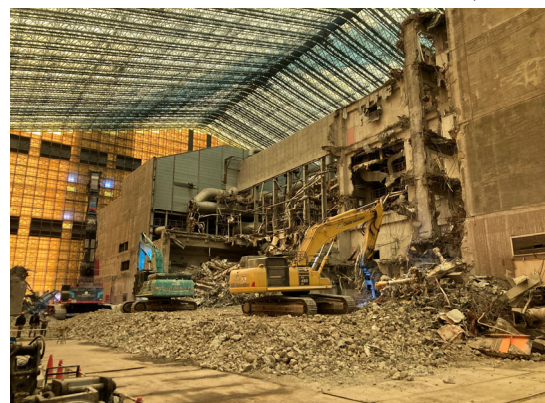
工場棟解体状況（工場棟東側）