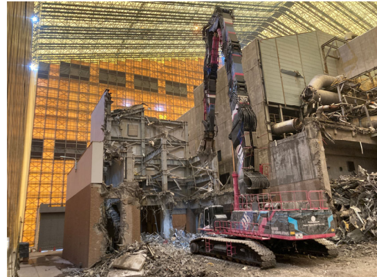
飛灰棟解体状況（工場棟南東側）