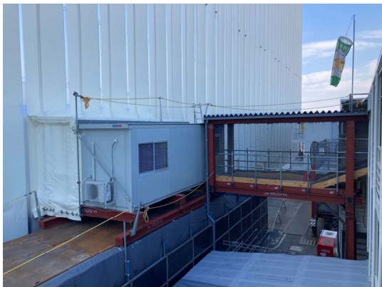
見学者ルーム設置状況（東側）