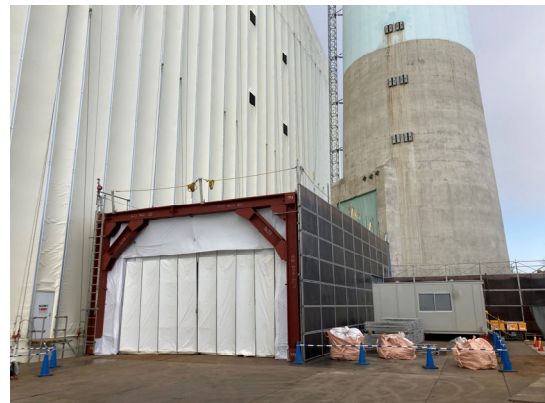
煙突管理区域前室組立完了（南側）