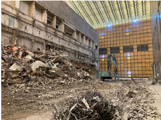
プラットフォーム基礎解体状況（工場棟北側）