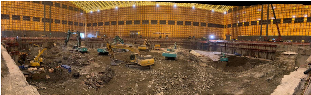
全覆いテント内全景（西側）