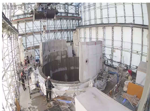
煙突外筒解体状況