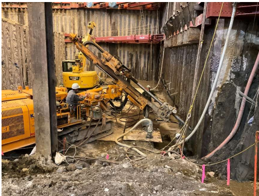
地盤アンカー施工状況（東側）