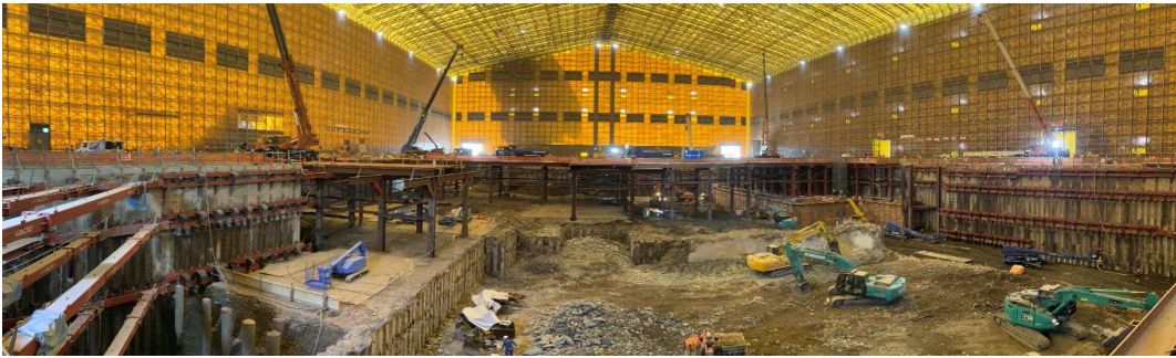
全覆いテント内全景（東側）