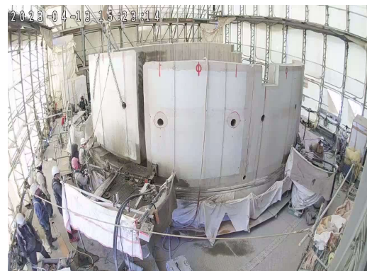
煙突外筒解体状況