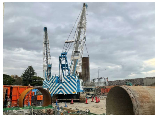
煙突地下障害撤去施工状況