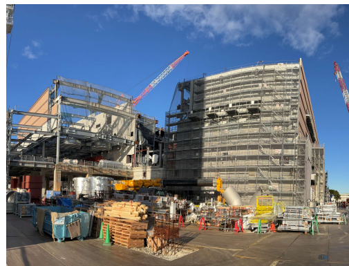
工場棟地上躯体工事施工状況（南東側）