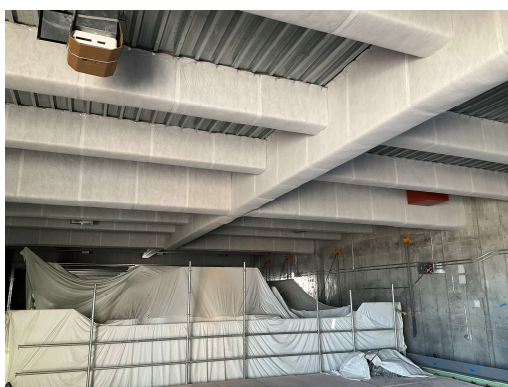
工場棟2階仕上げ工事耐火材施工状況（中央部）