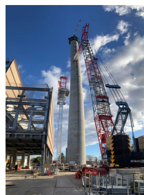
煙突地上躯体工事施工状況