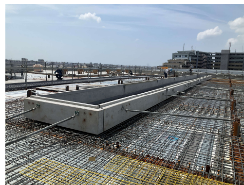
工場棟屋上躯体工事配筋・PC取付け施工状況