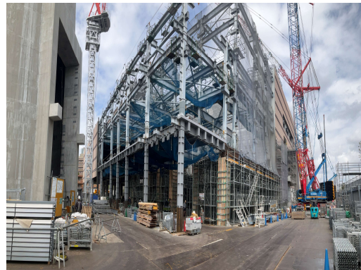
工場棟躯体工事施工状況（南東側）