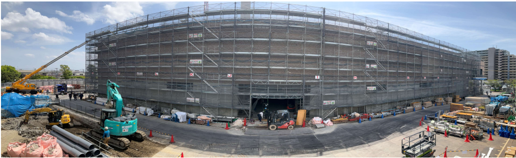
工場棟躯体外装工事全景（北側）