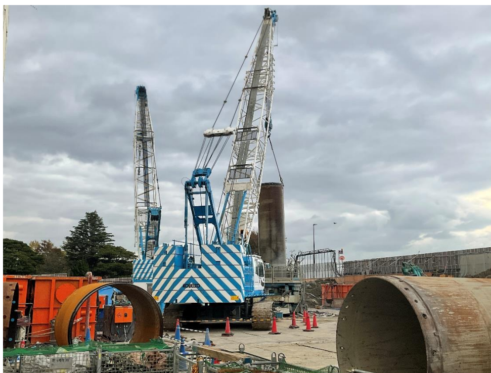
障害撤去施工状況